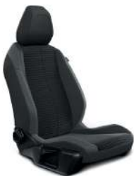
. Traxx Black & Fabric