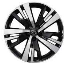
18" Diamond Cut Alloy Wheels