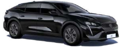
Black Perla Nera