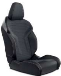
Partial Leather Seats