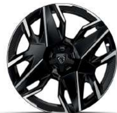
19" Diamond-Cut Alloy Wheels