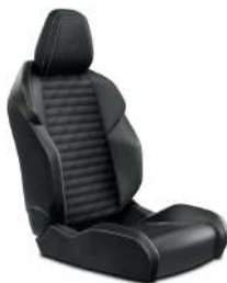
Nappa Leather Seats